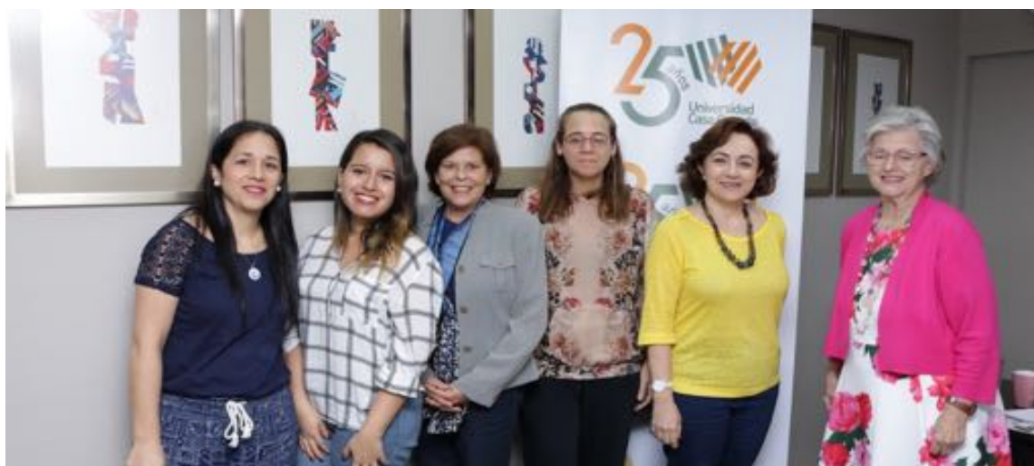
Firma de convenio con Universidad de Sao Paolo